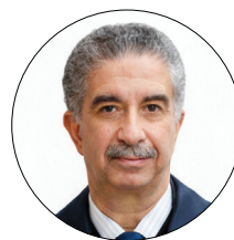
نامدار بقایی یزدی