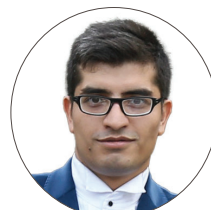
محمد نایب یزدی