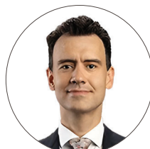
بورگان نظامی نرج آباد