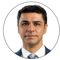
محمدرضا جهان پرور